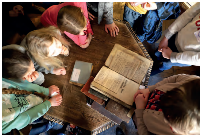
Lekcja archiwalna dla uczestników półkolonii Szkoły Muzycznej I stopnia w Szczecinie.

W maju zapoczątkowano ogólnopolską akcję społeczną tworzenia „Archiwum Pandemii AD 2020”, realizowanego także w AP w Szczecinie. Pozyskiwaliśmy fotografie, ulotki dokumentujące zmiany w naszej rzeczywistości wprowadzone reżimem sanitarnym, oraz trzy plakaty powstałe w ramach projektu „Czajkowski–Wietieszka: Sztuka Higieny”, będące częścią ogólnopolskiej kampanii społecznej.