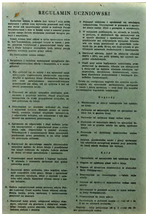
Fot. 6. Regulamin uczniowski z dziennika szkolnego.