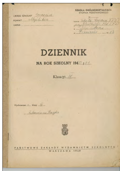
Fot. 1–2. Strony tytułowe dzienników lekcyjnych.